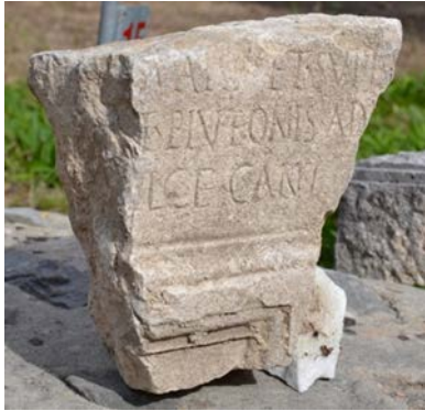
Fig. 7: CIL III, 9449