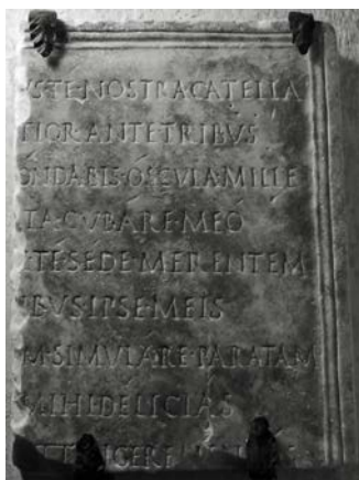
Fig. 5: CIL X, 659