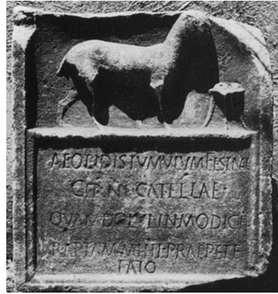
Fig. 8: Ann. Épigr. 1994, 348