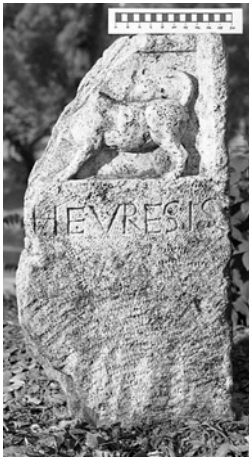
Fig1: CIL VI, 39093