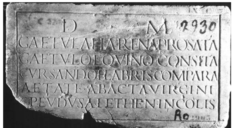
Fig. 6: CIL VI, 10082