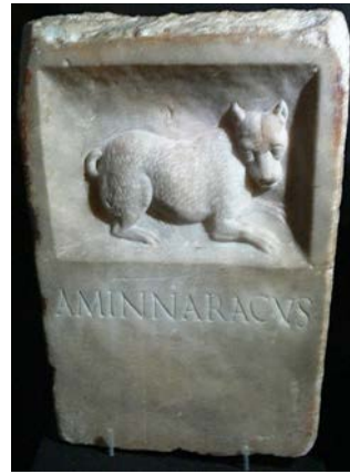
Fig. 2: CIL VI, 29895