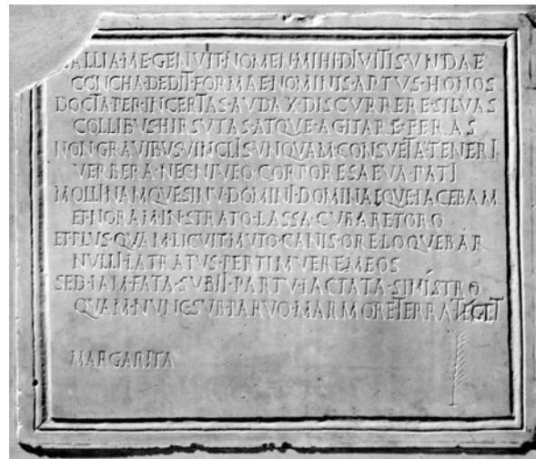
Fig. 4: CIL VI, 29896